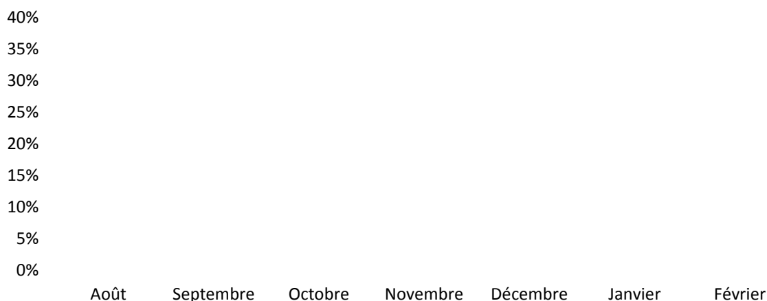
Figure 3 : Distribution des prélèvements sur le reste du territoire (n = 340 093)